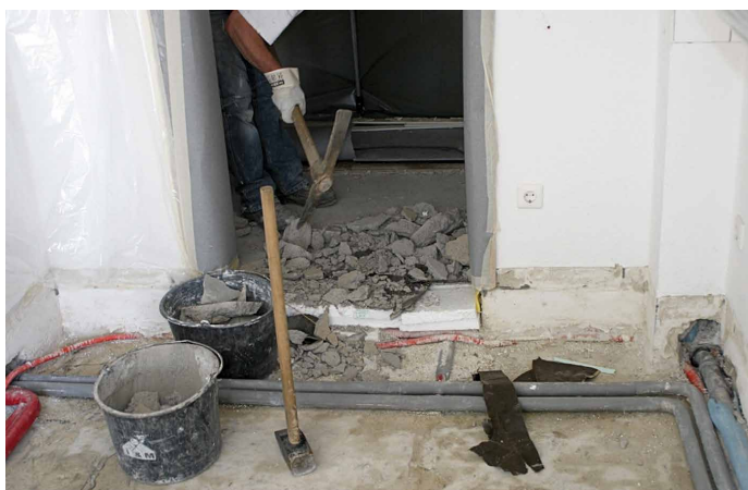
Abb. 3: Das Entfernen des Estrichs ist nur ein Teil der Rückbaumaßnahme. Nachfolgend wird mit dem neuen Estrich auch neue Feuchtigkeit eingebracht.

Das LGA Baden-Württemberg hat sich damit befasst, wie häufig und wie stark verschiedene Baustoffe mit Schimmelpilzen belastet sind. Bei Stichproben hat man unterschieden zwischen Fabrikneu, Baustelle, Neubau und Altbau. Die höchsten Keimbelastungen wurden im Bereich der Altbauten festgestellt. Dies ist natürlich keine Überraschung. Überraschend ist allerdings die Höhe der Schimmelpilzbelastungen, die insbesondere bei EPS (Styropor) Werte bis zu 3,2 \times 10^5 KBE/g ergaben. Herr Dr. Fischer vom LGA Baden-Württemberg stellte die Ergebnisse dieser Untersu-