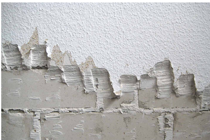
Abb. 1: Schimmelpilze sind Oberflächenbesiedler, gesunder Putz muss nicht entfernt werden.