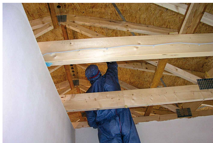
Abb. 2: Holzoberflächen, auf denen durch Bau- und Kondensfeuchte Schimmelpilz entstanden ist, müssen nicht ausgebaut werden.

mit Desinfektionsmittel zu behandeln und die Oberfläche zu reinigen. Natürlich ist es, wie schon erwähnt, eine andere Situation, wenn dauerhaft feuchte Putze marode und rissig sind oder auch keine feste Verbindung mehr zum Mauerwerk aufweisen oder wenn sie aus Gründen der technischen Trocknung entfernt werden müssen. Wenn bei Holz holzerstörende Pilze nachgewiesen werden, ist logischerweise ebenfalls Rückbau angesagt.