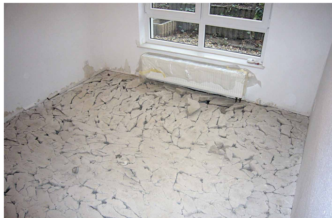
Abb. 4: Dieser Raum ist in den nächsten Wochen nicht nutzbar.